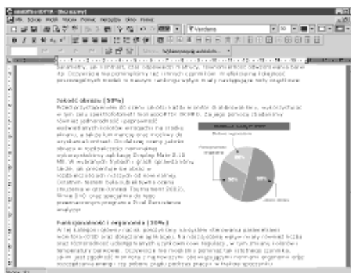
Rys. 1. miniOffice™ Edyta - edytor tekstu